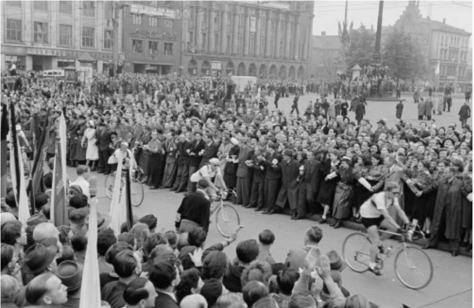
Foto: Renate und Roger Rössing, in: Deutsche Fotothek der SLUB Dresden, Aufnahme-Nr.: df_roe-neg_0006288_007, Datensatz-Nr.: obj88888626