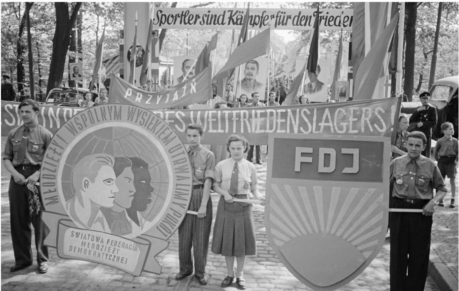
Foto: Erich Höhne / Erich Pohl, in: Fotothek der SLUB Dresden, Aufnahme-Nr.: df_hp_0035188_037, Datensatz-Nr.: obj 70604108

Am polnisch-deutschen Grenzübergang in Görlitz wird die Ankunft der Friedensfahrer gefeiert.