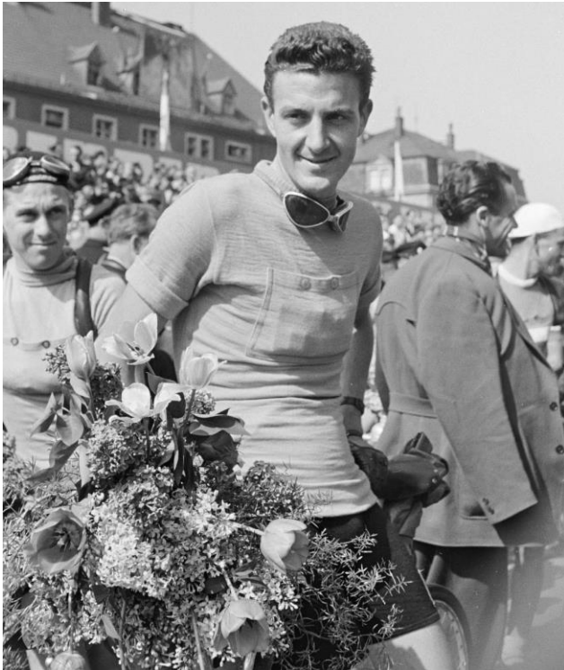
Foto: Erich Höhne / Erich Pohl, in: Fotothek der SLUB Dresden, Aufnahme-Nr.: df_hp_0035312_030, Datensatz-Nr.: obj 70604115